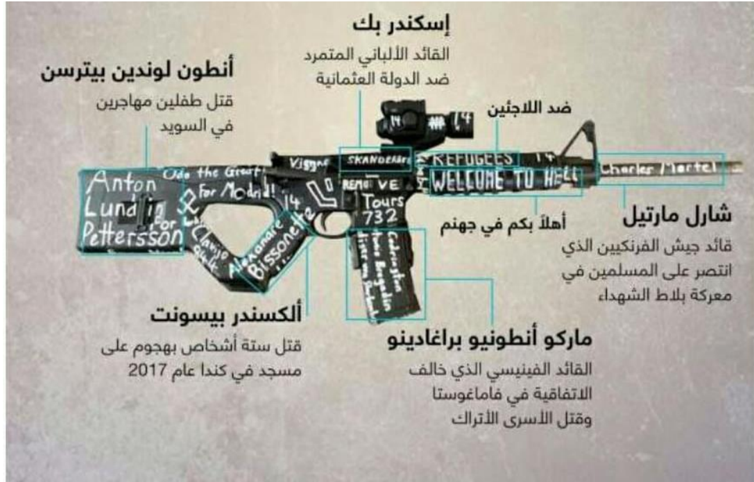
عبارات كتبت على سلاح الإرهابي Tarrant