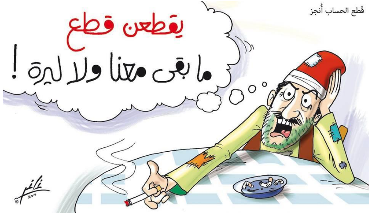
كاريكاتير " الجمهورية".