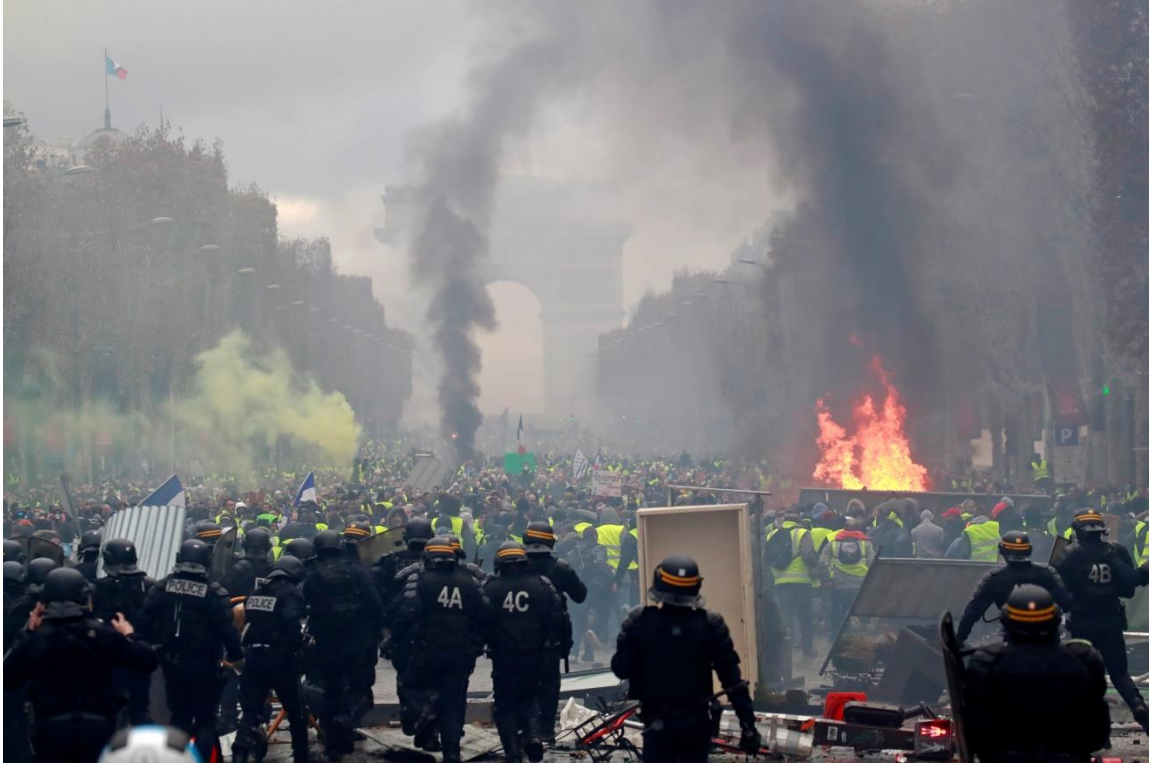
صورة عن حالة الشغب في شارع "الشانزلزيه".

في حين تلقف الرئيس بإيجابية مطالب المتظاهرين، وفي حين بدأت الحكومة الفرنسية البحث في كيفية تنفيذ قرارات الاليزيه، أعلن العديد من منظمي تحركات "السترات الصفراء" الدعوة إلى "فصل خامس" من الاحتجاجات، في يوم الخامس عشر من الشهر الحالي، معتبرين أن خطاب ماكرون وإجراءاته أتت متأخرة، فضلاً عن أنها تجاهلت الأثرياء، حيث يطالب أصحاب "السترات الصفراء" بفرض الضريبة على الثروة، في حين يعتبر ماكرون أن فرض تلك الضريبة ستسبب بهروب المستثمرين وفقدان فرص العمل. " (5)